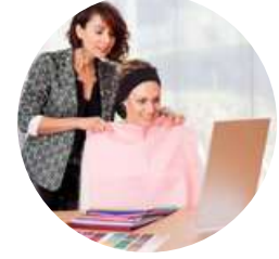
Conseil en image