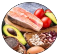
Bien manger, plaisir et équilibre