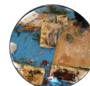
Arts et relaxation