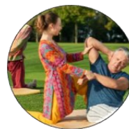
Activités physiques adaptées