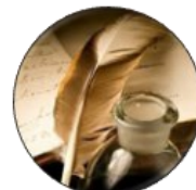
Traces de vie