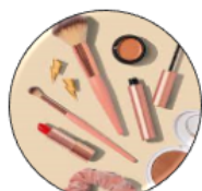
Bulles de beauté